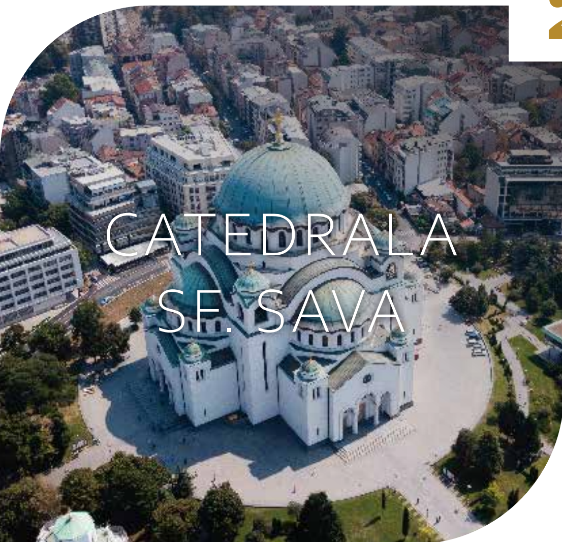
CATEDRALA SF. SAVA